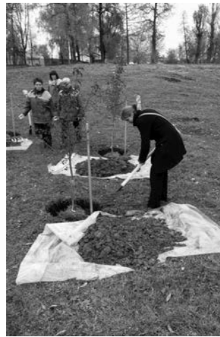
Baumpflanzaktion während der 7. Deutsch-Belarussischen Städtepartnerschaftskonferenz 2009 in Mogiljow

Außerdem wird in den folgenden Arbeitsgruppen diskutiert: